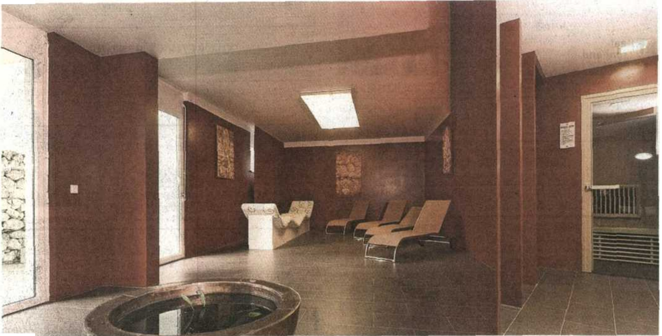
Sauna und Fitnessräume sind Teil der Annehmlichkeiten eines Boarding House.